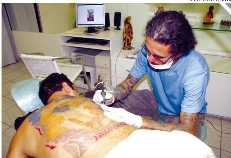
Estabelecimento que desrespeitar lei pode ser multado e ter alvará cassado