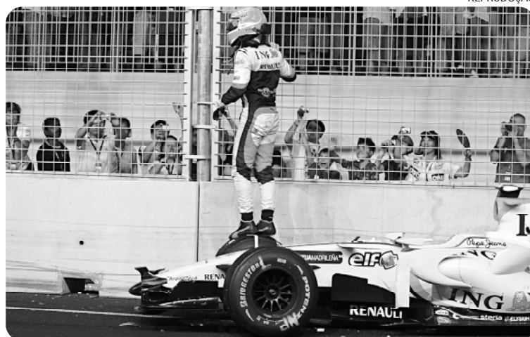
A batida do piloto brasileiro contra o muro foi muito estranha em 2008

O acidente do Nelsinho teria sido premeditado para que houvesse a entrada do carro de segurança em Cingapura. Ele bateu de uma forma muito estranha. Recentemente, conversando com o Felipe Massa, ele me chamou a atenção disso. E o Felipe foi ao Briatore e disse: "Essa batida não está certa, aconteceu porque vocês quiseram". Outros pilotos levantaram esta hipótese na época e agora isso vem à tona por causa da investigação que a FIA está fazendo. Ela contratou uma empresa independente e tem depoimentos contundentes que incriminam Flávio Briatore - disse Reginaldo Leme na transmissão do GP da Bélgica na Rede Globo.