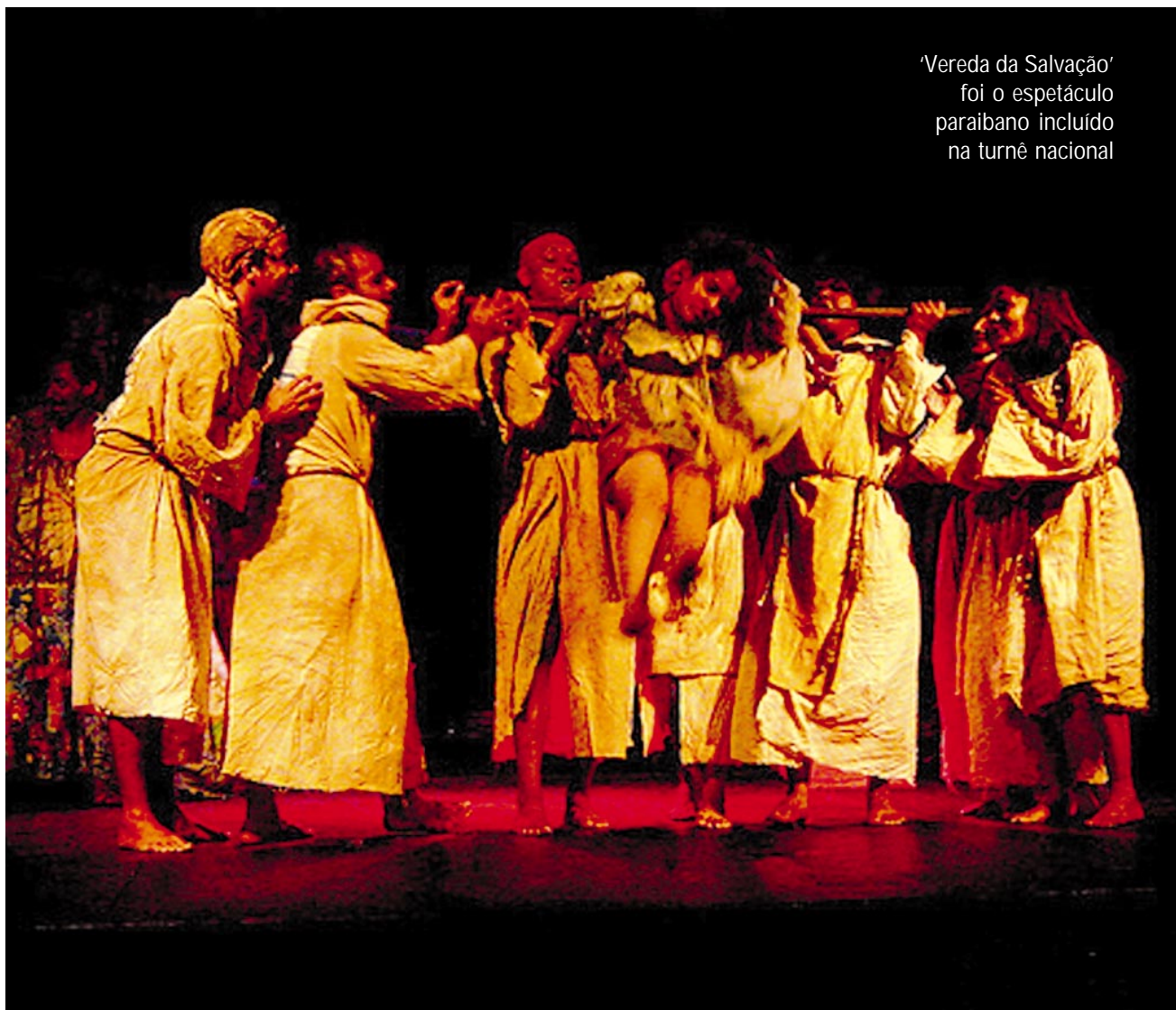
'Vereda da Salvação' foi o espetáculo paraibano incluído na turnê nacional

Também vai variar o número de sessões em cada local. Já o valor máximo de ingresso que as montagens poderão cobrar é R$ 40,00 (a média tem sido de R$ 20,00 segundo a Petrobras).