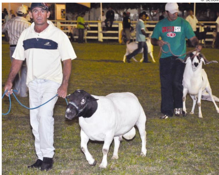
Os eventos de agronegócios permitem aos produtores exibirem seus animais

Em suas administrações anteriores, o governador impulsionou o setor agropecuário