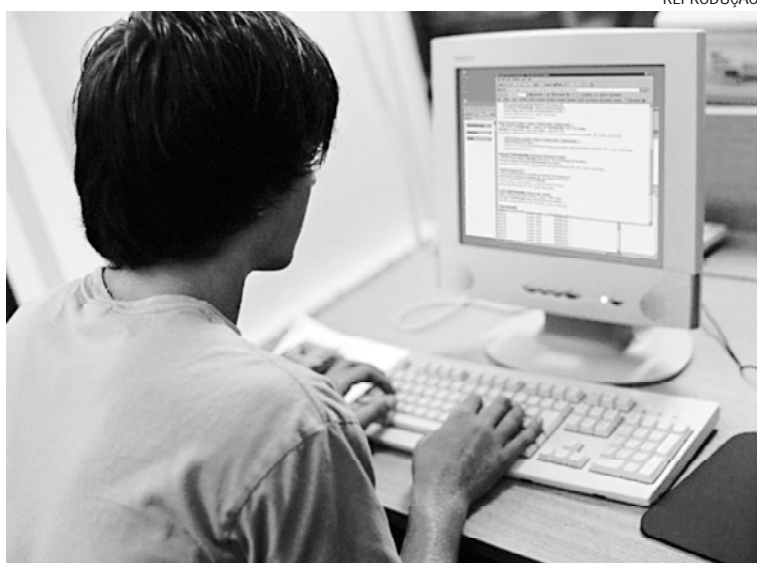
As inscrições são feitas pela internet, sendo cobrada uma taxa de R$ 25,00

O candidato deve preencher completamente o formulário de inscrição no endereço eletrônico, anexando o curriculum vitae, diploma ou comprovante de conclusão do curso superior digitalizado e do pagamento da taxa de inscrição ou protocolo de depósito digitalizado. O edital completo do processo está disponível no endereço www.nectar.org.br .