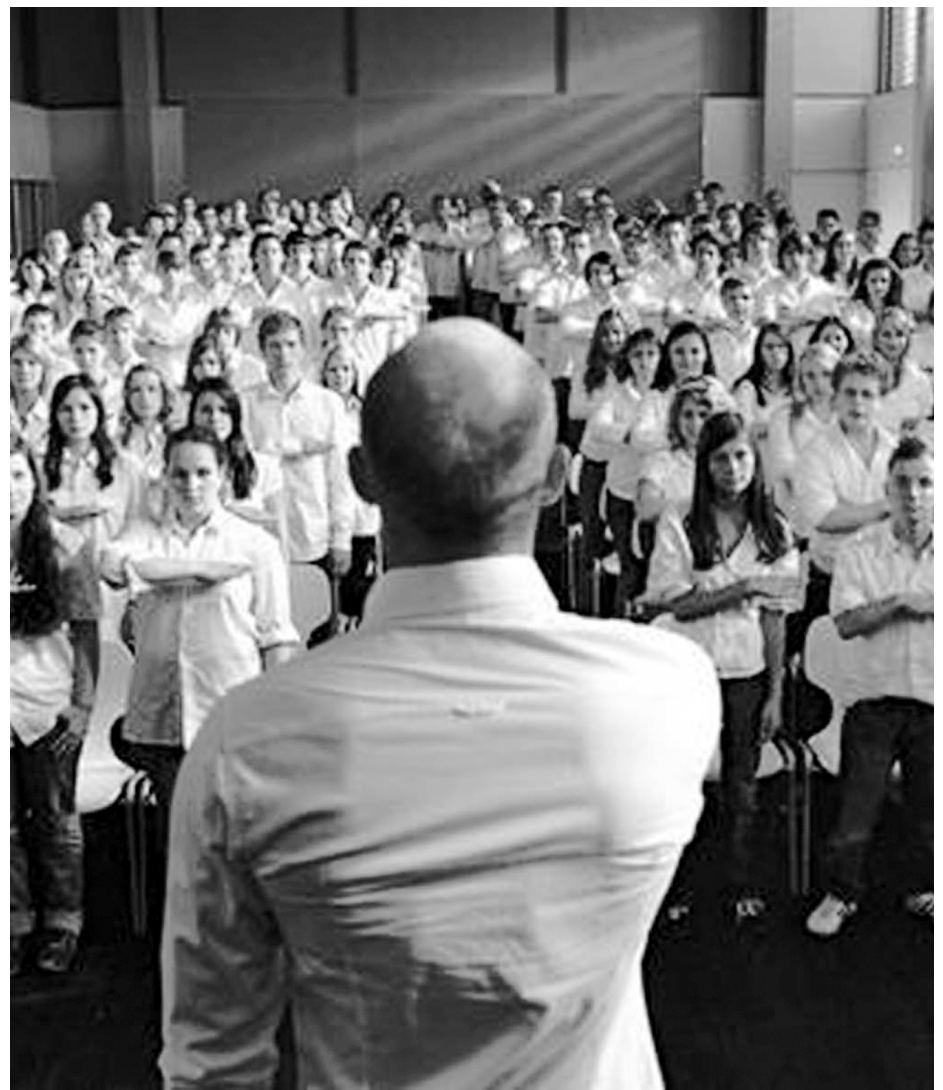
O polêmico filme alemão 'A Onda' continua em exibição no Box 3, em João Pessoa