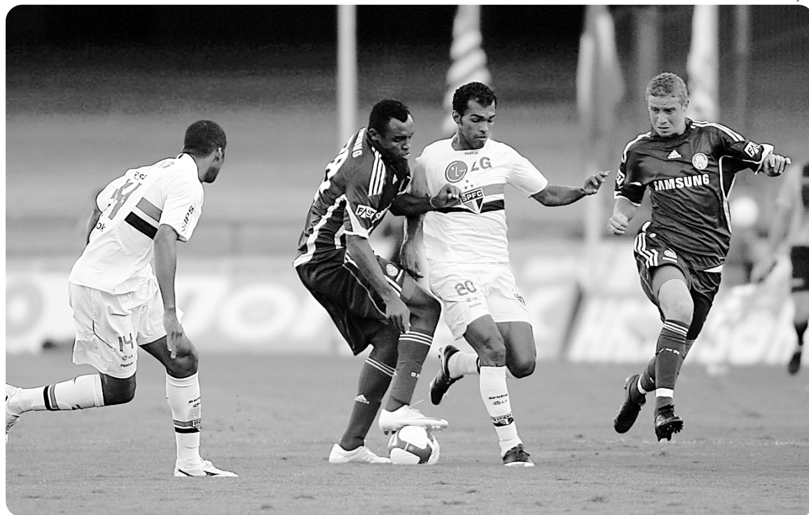
No clássico paulista, São Paulo e Palmeiras ficaram iguais no placar, num dos jogos mais fracos do Brasileiro

Na verdade a rodada começou quarta-feira (26) com o empate entre Barueri e Corinthians, por 2 a 2, e teve outros três jogos sábado (29) à noite, com vitórias dos mandantes: Flamengo, Coritiba e Náutico.