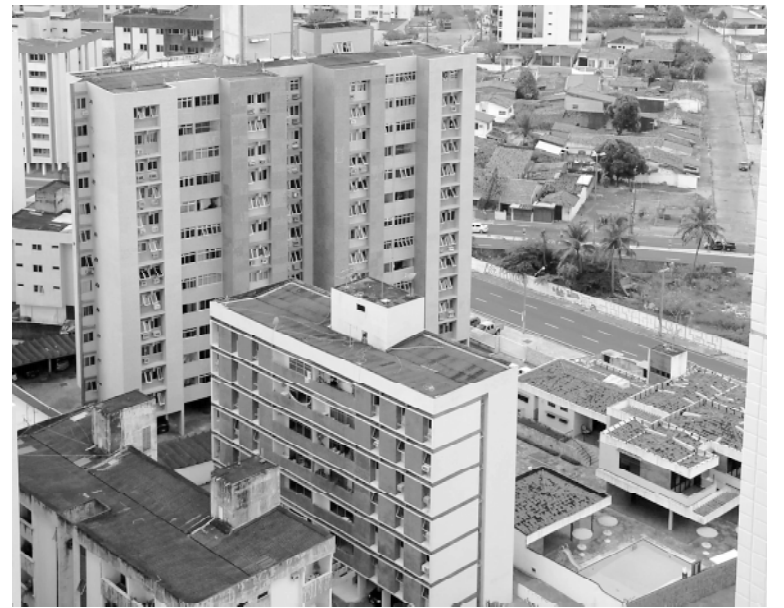
Preços dos aluguéis residenciais devem baixar no mês de setembro

No ano, o IGP-M acumula queda de 2,02% e nos últimos 12 meses, de 0,71%. Inquilinos com contratos que vencem em setembro, e com correção pelo Índice Geral de Preços do Mercado (IGP-M), devem ter o valor do aluguel re-