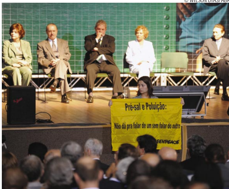
Lula anunciou ontem as regras da exploração do óleo em águas profundas

A ressalva do governador paraibano se deu em virtude do resultado de uma reunião no domingo (30) entre Lula e os governadores José Serra, de São Paulo; Sérgio Cabral, do Rio de Janeiro, e Paulo